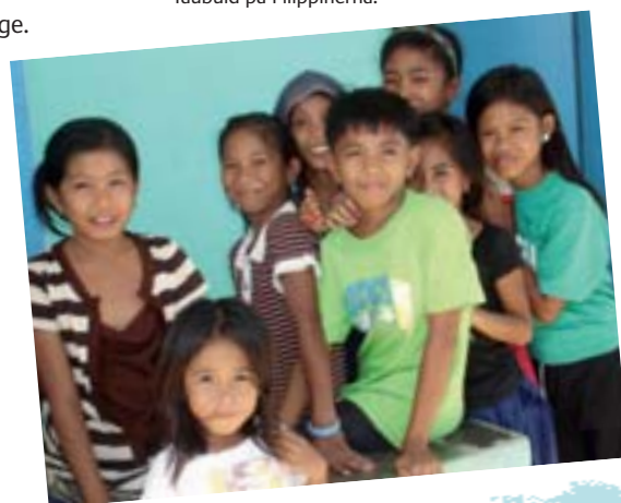
Nomadfolket valde att bosätta sig i byn Tamisan, så att barnen skulle kunna gå i skolan.