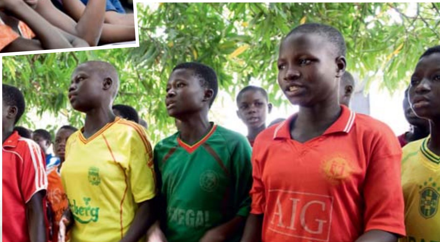
Spelarna, deras coacher, lärare och föräldrar samlas för en utvärdering av satsningen på flickfotboll. Flickorna har blivit mer motiverade att gå i skolan och de vågar prata mer.