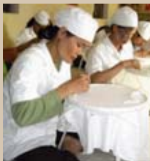
Kvinnorna som deltar i ett Planprojekt för att lära sig brodera kan nu försörja sig och sina familjer.