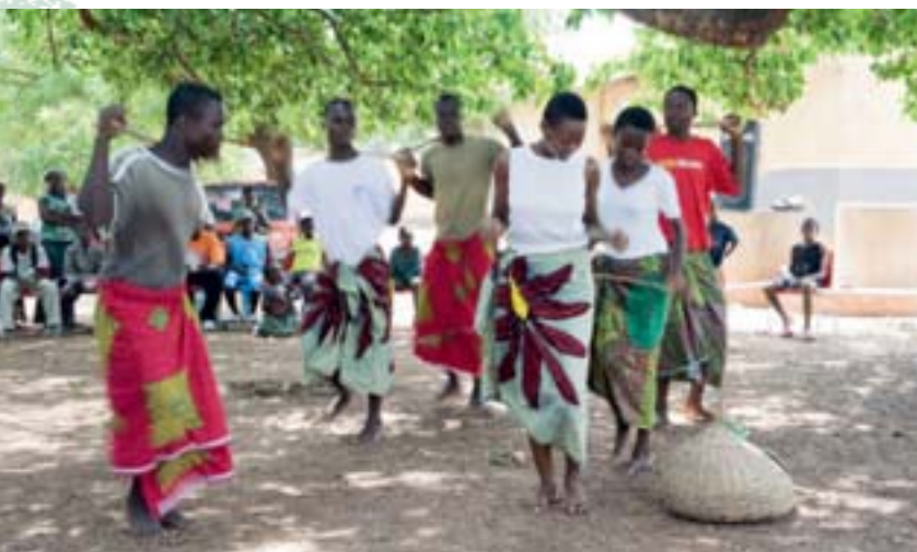
Genom dans och musik lockas åskådarna till gatuteaterföreställningarna.