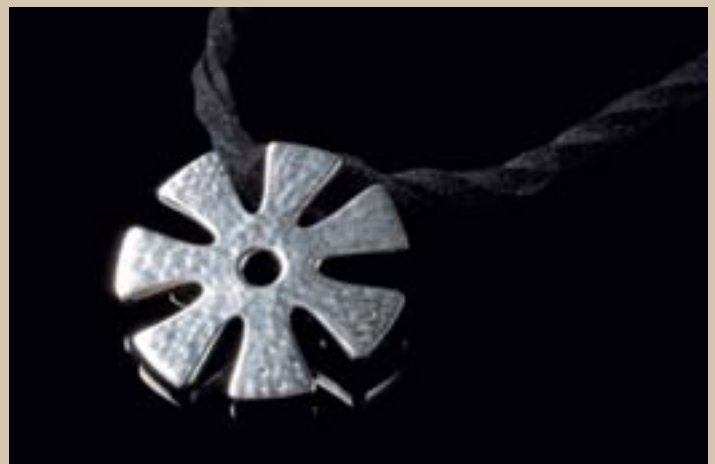
Plansmycket säljs till förmån för utbildningsinsatser i Malawi.