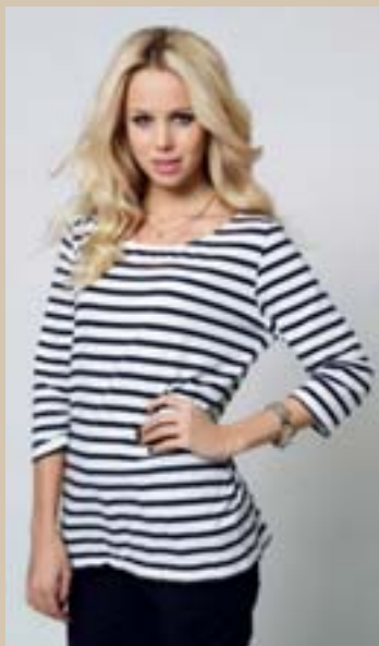
Modebloggaren Elin Kling är både fadder och Planambassadör.

Elin Kling skriver om mode i Expressen och har även en välbesökt modeblogg på TV4.se. Hon har varit fadder i Plan sedan 2006 och har det senaste året engagerat sig ytterligare genom att bli Planambassadör.