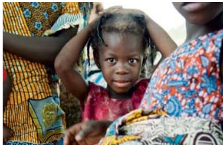
Barnen i publiken lyssnar intensivt på informationen om barns rättigheter.