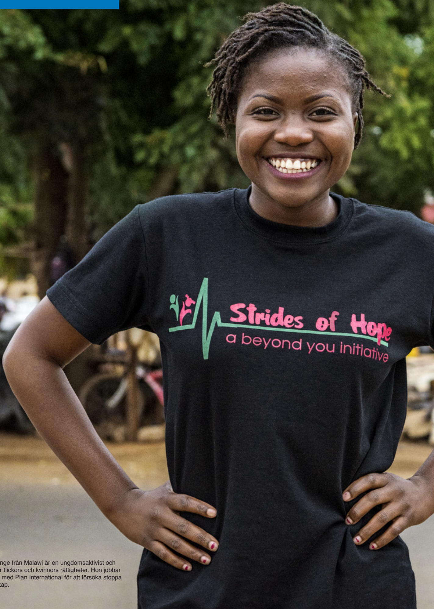
24-åriga Tionge från Malawi är en ungdomsaktivist och förkämpe för flickors och kvinnors rättigheter. Hon jobbar tillsammans med Plan International för att försöka stoppa barnäktenskap.