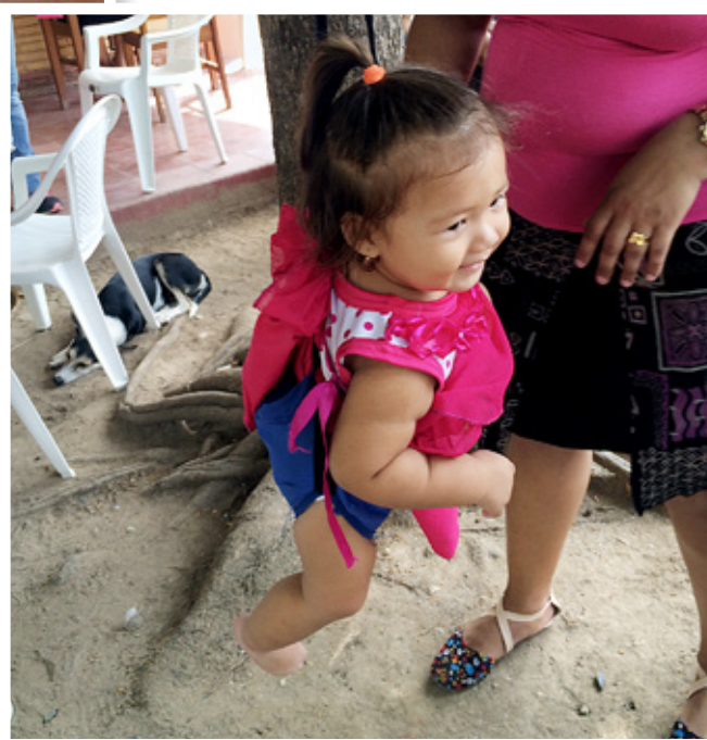
Barnen i byn vägs regelbundet av en sjuksköterska.