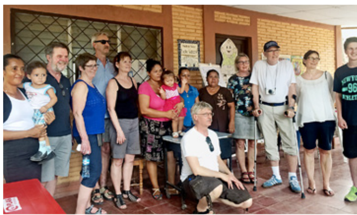
Faddrarna på besök på hälsocentret i Rincón García.

– Jag berättade att jag har varit med i olika projekt sedan jag var 10 år gammal. På den tiden var jag blyg och fick panik inför att prata offentligt. Men nu har mitt liv förändrats, jag tycker om att jobba med sociala frågor och att lösa problem.