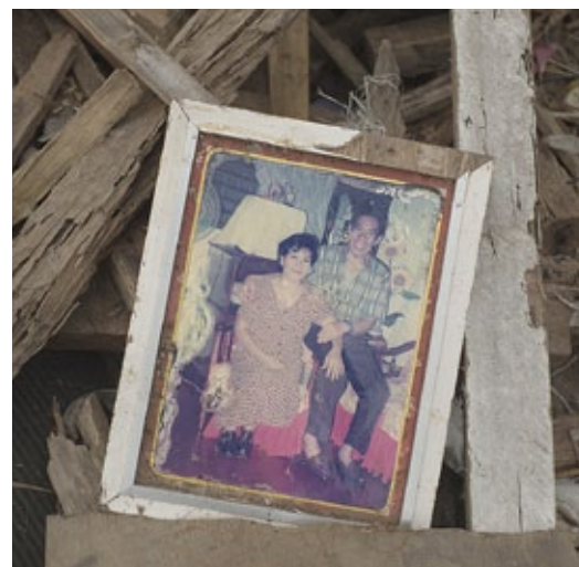
En familjs öde. Vi vet inte vad som har hänt med dem.

”När jag blir stor vill jag bli forskare. Någon som upptäcker vad en tyfon är och vad som händer med jorden. Jag vill gå i skolan så att jag kan fullfölja mina planer och skydda min familj från fattigdom och sjukdom i framtiden. Och jag vill ha en stor och lycklig familj, det är allt.”