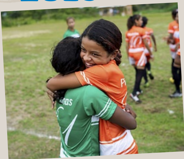
Brasilien 19 februari–7 mars