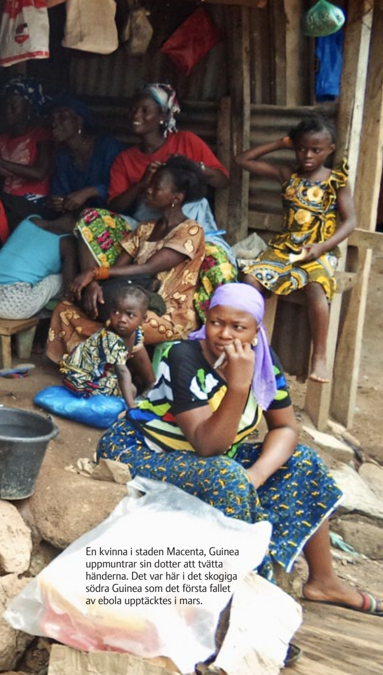
En kvinna i staden Macenta, Guinea uppmuntrar sin dotter att tvätta händerna. Det var här i det skogiga södra Guinea som det första fallet av ebola upptäcktes i mars.