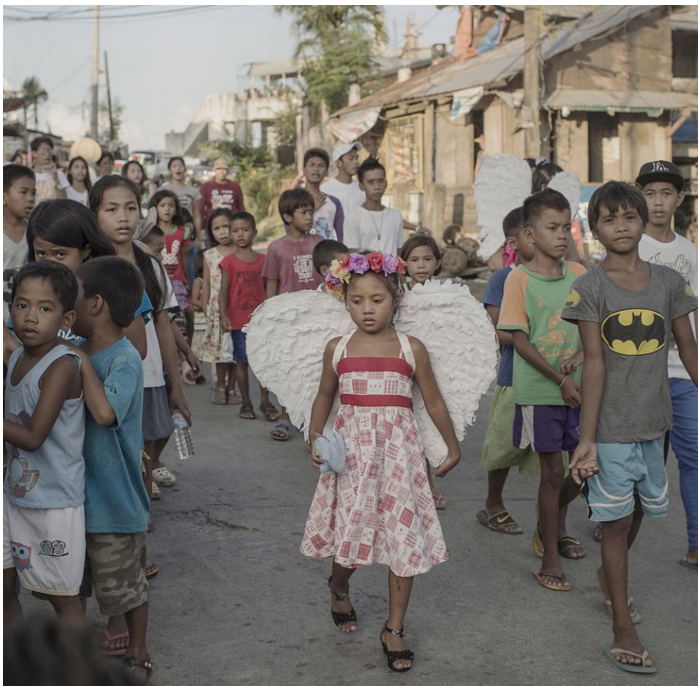
Barn deltar i en katolsk procession för att hedra Jungfru Maria. Att upprätthålla traditioner i katastrofsituationer är viktigt för att återfå en känsla av vardag och normalitet.