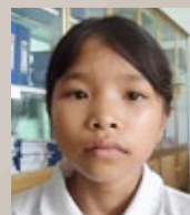
HÁ, 10 ÅR, VIETNAM

– Jag tycker om att äta fisksoppa. Jag brukar fiska själv och om jag får napp så tar jag med mig fisken till mormor så lagar vi den och äter den tillsammans. Jag kan koka fläsk och grönsaker och laga ris i riskokaren.