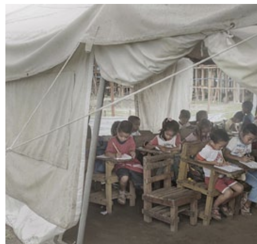
Barnen i Santo Nino har lektioner i tält sedan januari.