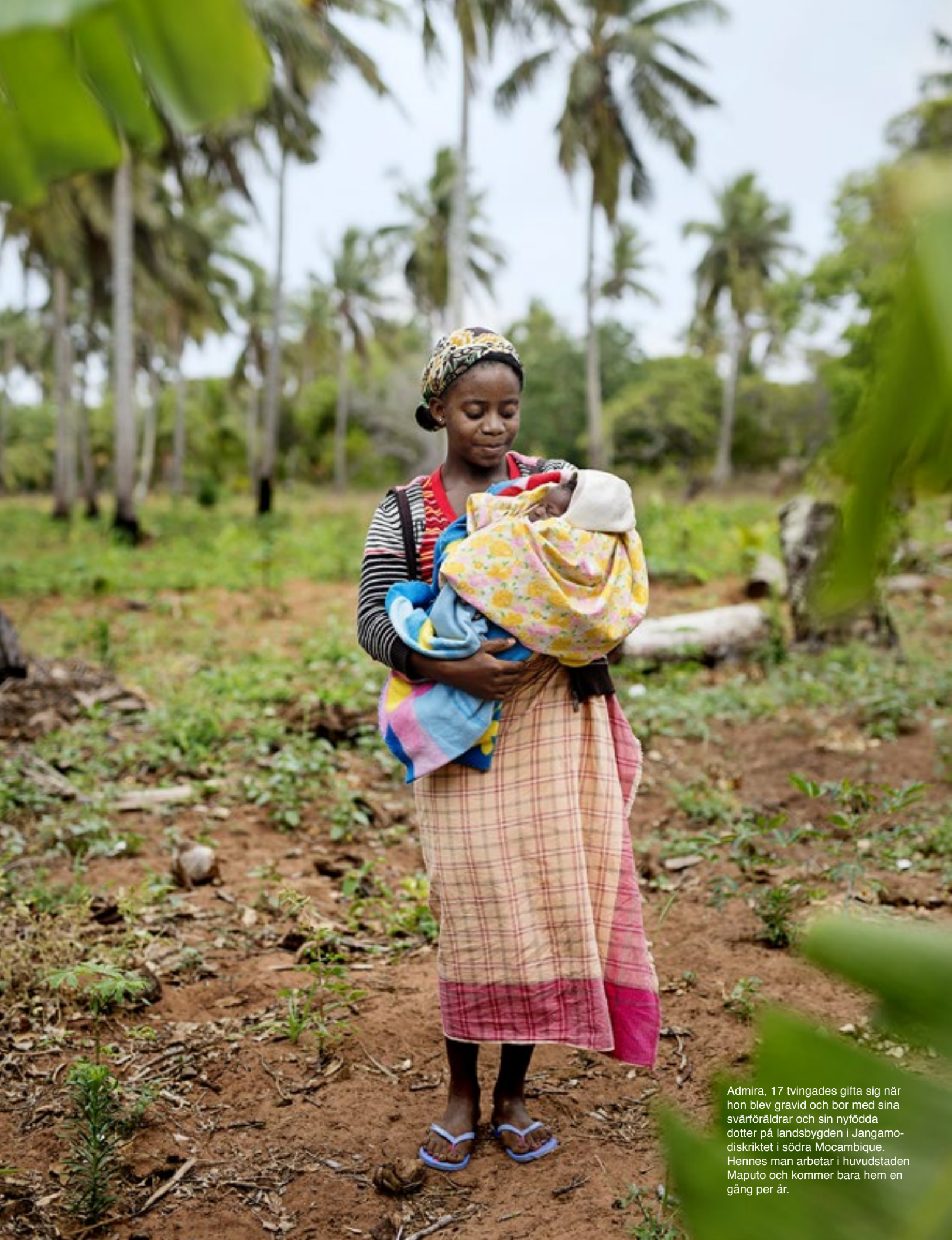
Admira, 17 tvingades gifta sig när hon blev gravid och bor med sina svärföräldrar och sin nyfödda dotter på landsbygden i Jangamo-diskriktet i södra Mocambique. Hennes man arbetar i huvudstaden Maputo och kommer bara hem en gång per år.