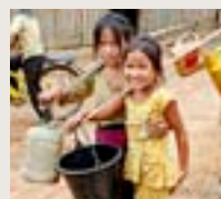
Laos/Thailand Mars 2015 Minoritetsfadder