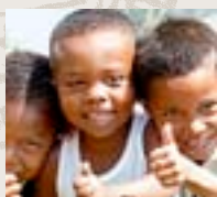
Colombia November 2014

Mer information på: www.plansverige.org/res-med-plan . Nyfiken? Besök Plans gruppresor på Facebook. För frågor och anmälan kontakta Givarservice via e-post: fadder@plansverige.org eller telefon 08-58 77 55 00.