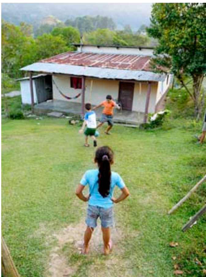
Trots våld och kriminalitet i samhället finns det fortfarande tid för lek.

En annan bild föreställer en flicka som går ensam till en offentlig