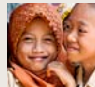
Indonesien Maj 2015

Vi reserverar oss för förändringar i resplanen. Minimum 20 deltagare krävs för att en resa ska bli av.