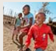
Zimbabwe April 2015