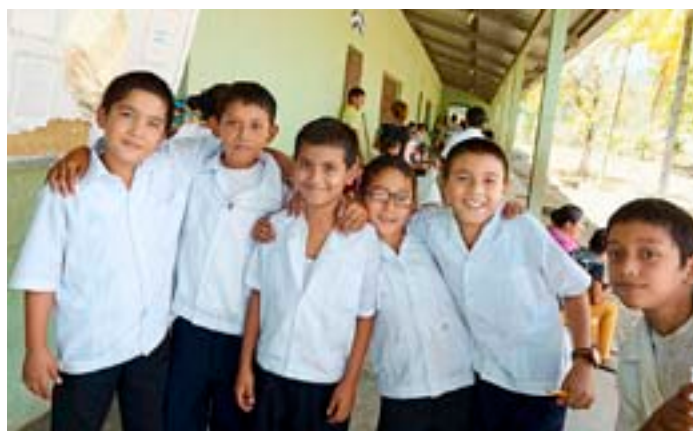
Våld drabbar både killar och tjejer.