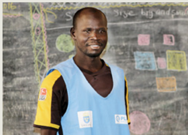
Kwada undervisar med sång och dans.